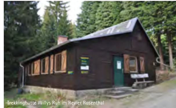
Trekkinghütte Willys Ruh im Revier Rosenthal