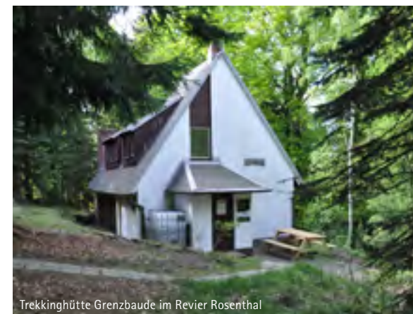
Trekkinghütte Grenzbaude im Revier Rosenthal