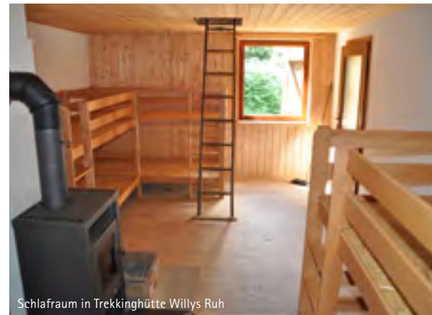
Schlafraum in Trekkinghütte Willys Ruh