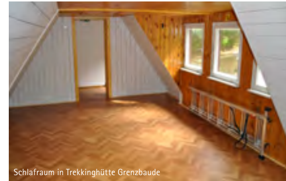
Schlafraum in Trekkinghütte Grenzbaude

Informationen zu den Hütten, Wanderrouten und Ticketverkaufsstellen findest du unter: www.trekkinghuetten.de