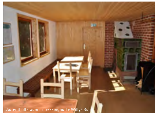
Aufenthaltsraum in Trekkinghütte Willys Ruh